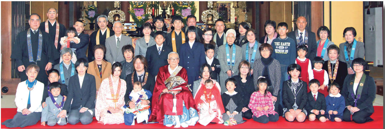
第48回初参式・第18回入園・入学奉告式。